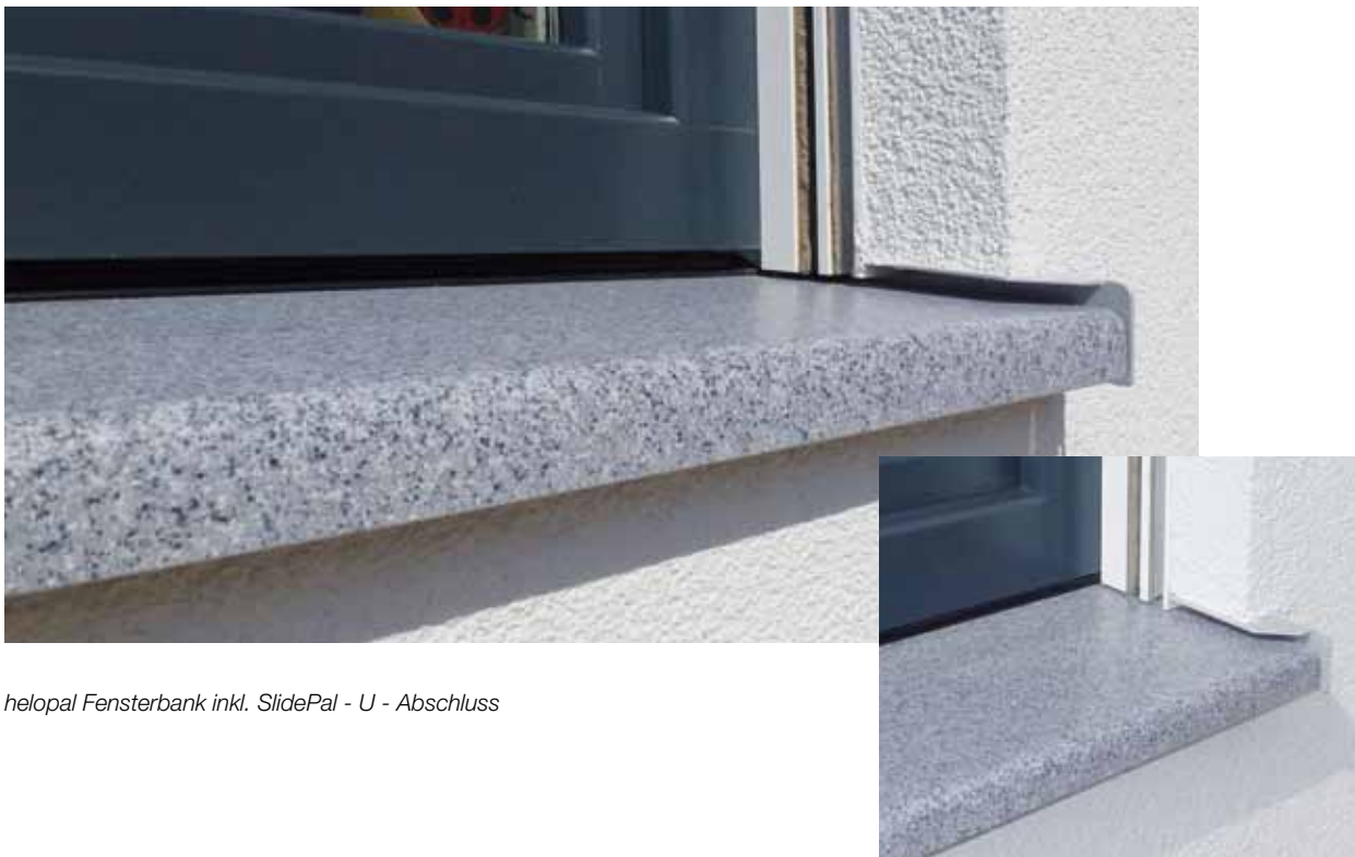
helopal Fensterbank inkl. SlidePal - U - Abschluss

Das innovative Anschlussystem für helopal, puritamo und Fenorm Aluminium Fensterbänke ist ab Frühjahr 2013 verfügbar.