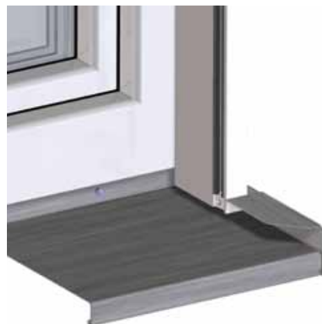
Abb.: System SlideAlu - U - Abschluss